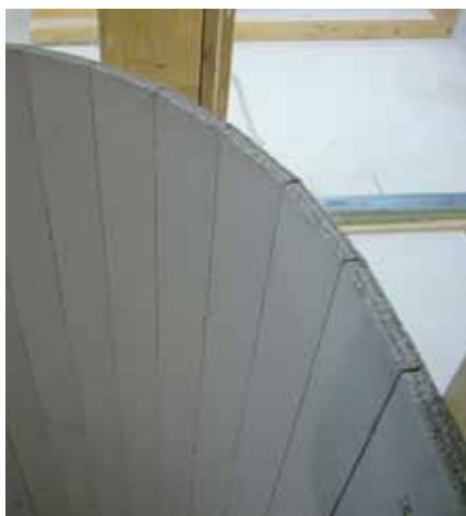
Kolejne kroki podczas wykonywania nacięć w płycie